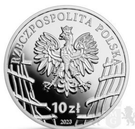
Prezentacja monety okolicznościowej