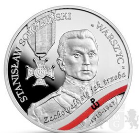
Prezentacja monety okolicznościowej

Wydarzenie zostało zorganizowane przez Oddział Instytutu Pamięi Narodowej w Katowicach oraz Oddział Okręgowego Narodowego Banku Polskiego w Katowicach.