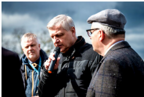
Institut Pamięci Narodowej oddał hołd rodzinie Zimoniów z Rybnika - Rybnik, 25 marca 2024.