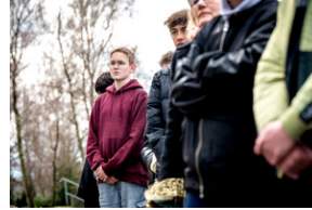
Institut Pamięci Narodowej oddał hołd rodzinie Zimoniów z Rybnika - Rybnik, 25 marca 2024.