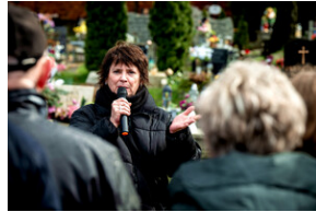
Institut Pamięci Narodowej oddał hołd rodzinie Zimoniów z Rybnika - Rybnik, 25 marca 2024.