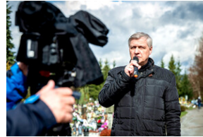
Institut Pamięci Narodowej oddał hołd rodzinie Zimoniów z Rybnika - Rybnik, 25 marca 2024.