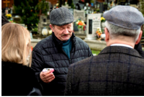
Instytut Pamięci Narodowej oddał hołd rodzinie Zimoniów z Rybnika - Rybnik, 25 marca 2024.