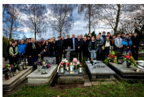
Instytut Pamięci Narodowej oddał hołd rodzinie Zimoniów z Rybnika - Rybnik, 25 marca 2024.