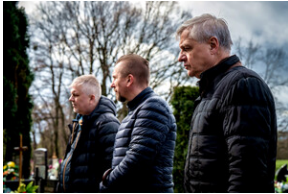
Institut Pamięci Narodowej oddał hołd rodzinie Zimoniów z Rybnika - Rybnik, 25 marca 2024.