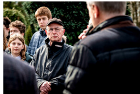
Institut Pamięci Narodowej oddał hołd rodzinie Zimoniów z Rybnika - Rybnik, 25 marca 2024.