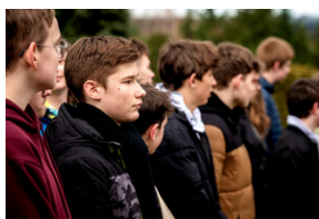
Instytut Pamięci Narodowej oddał hołd rodzinie Zimoniów z Rybnika - Rybnik, 25 marca 2024.