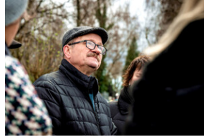
Instytut Pamięci Narodowej oddał hołd rodzinie Zimoniów z Rybnika - Rybnik, 25 marca 2024.