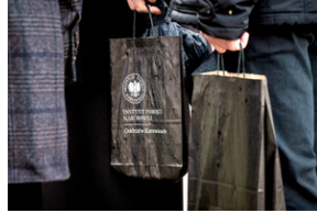
Instytut Pamięci Narodowej oddał hołd rodzinie Zimoniów z Rybnika - Rybnik, 25 marca 2024.