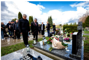
Institut Pamięci Narodowej oddał hołd rodzinie Zimoniów z Rybnika - Rybnik, 25 marca 2024.