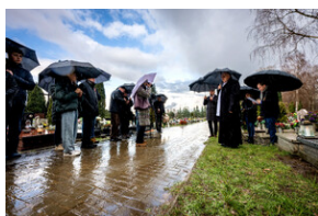
Instytut Pamięci Narodowej oddał hołd rodzinie Zimoniów z Rybnika - Rybnik, 25 marca 2024.