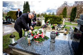
Institut Pamięci Narodowej oddał hołd rodzinie Zimoniów z Rybnika - Rybnik, 25 marca 2024.