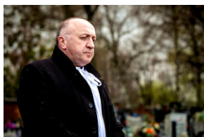
Instytut Pamięci Narodowej oddał hołd rodzinie Zimoniów z Rybnika - Rybnik, 25 marca 2024.