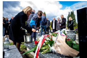
Institut Pamięci Narodowej oddał hołd rodzinie Zimoniów z Rybnika - Rybnik, 25 marca 2024.