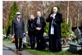
Institut Pamięci Narodowej oddał hołd rodzinie Zimoniów z Rybnika - Rybnik, 25 marca 2024.