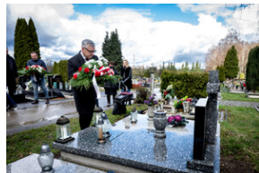
Institut Pamięci Narodowej oddał hołd rodzinie Zimoniów z Rybnika - Rybnik, 25 marca 2024.