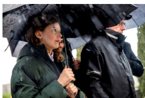
Instytut Pamięci Narodowej oddał hołd rodzinie Zimoniów z Rybnika - Rybnik, 25 marca 2024.