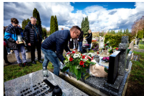
Institut Pamięci Narodowej oddał hołd rodzinie Zimoniów z Rybnika - Rybnik, 25 marca 2024.