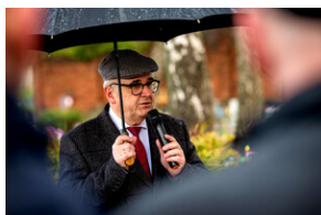
Instytut Pamięci Narodowej oddał hołd rodzinie Zimoniów z Rybnika - Rybnik, 25 marca 2024.