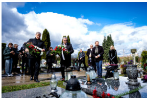
Institut Pamięci Narodowej oddał hołd rodzinie Zimoniów z Rybnika - Rybnik, 25 marca 2024.