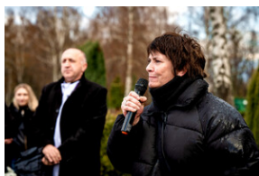
Instytut Pamięci Narodowej oddał hołd rodzinie Zimoniów z Rybnika - Rybnik, 25 marca 2024.