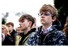
Institut Pamięci Narodowej oddał hołd rodzinie Zimoniów z Rybnika - Rybnik, 25 marca 2024.