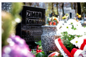
Instytut Pamięci Narodowej oddał hołd rodzinie Zimoniów z Rybnika - Rybnik, 25 marca 2024.