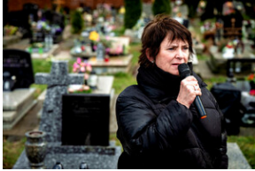
Institut Pamięci Narodowej oddał hołd rodzinie Zimoniów z Rybnika - Rybnik, 25 marca 2024.